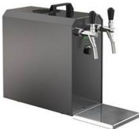
Rysunek 7 Przykładowy nalewak do napojów