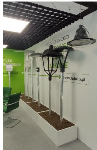
Rysunek 5 Stojaki na oprawy uliczne i parkowe