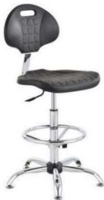
Rysunek 4 Krzesła barowe