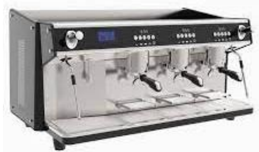
Rysunek 6 Przykładowy ekspres do kawy