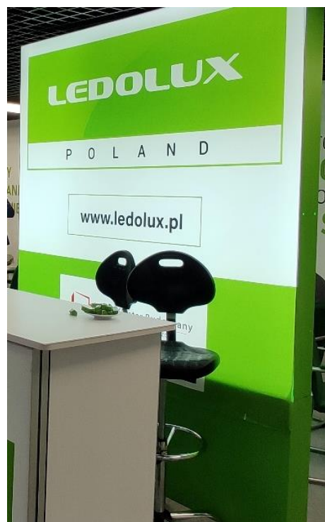
Rysunek 2 Ściana dekoracyjna LOGO