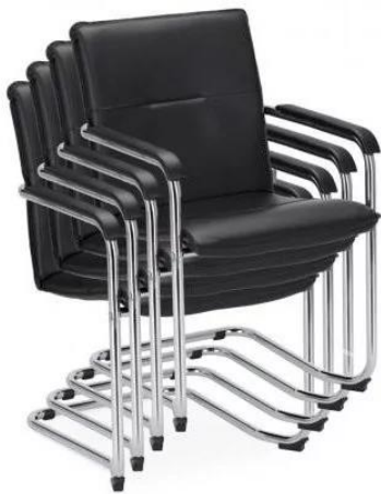
Rysunek 3 Krzesła