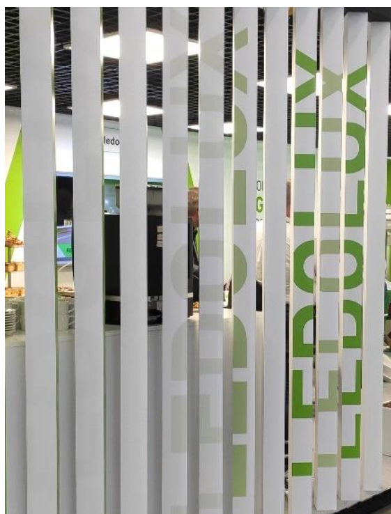
Rysunek 1 Ściana dekoracyjna