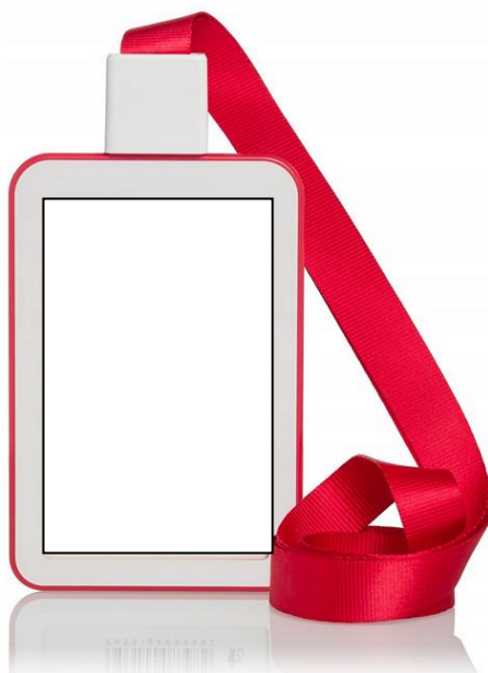
Planowany harmonogram misji